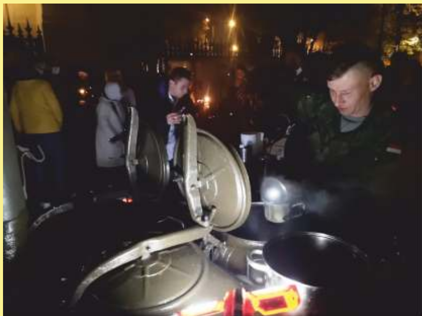
Wojskowa kuchnia polowa.