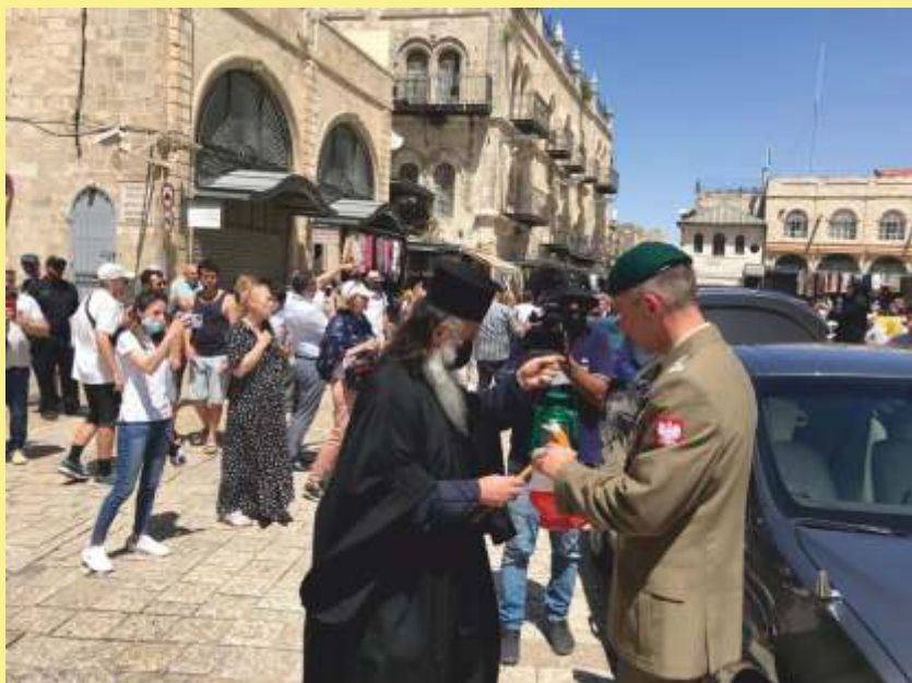
Odbiór Świętego Ognia w Jerozolimie.