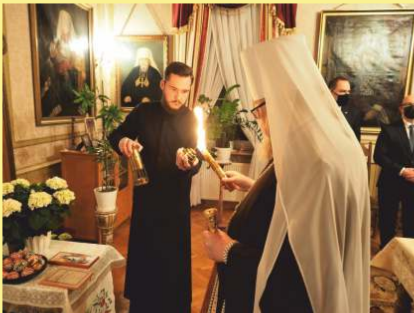
Święty Ogień w Domu Metropolitalnym.