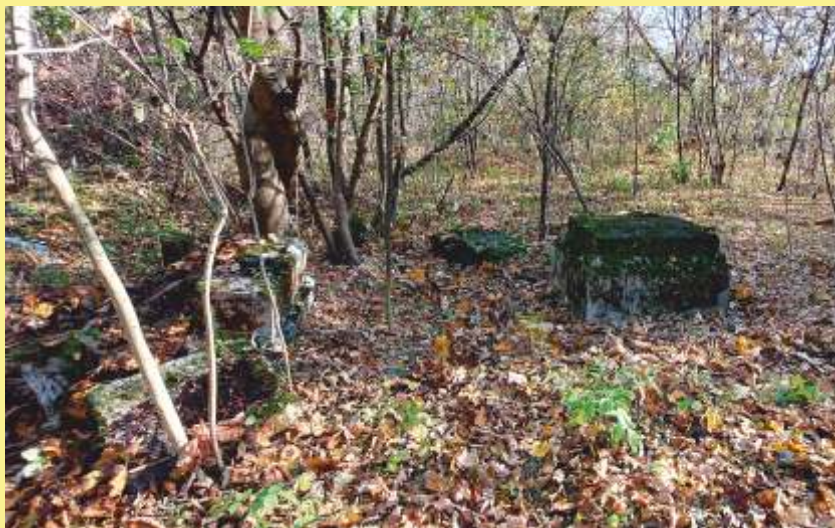
Podczas prac inwentaryzacyjnych.