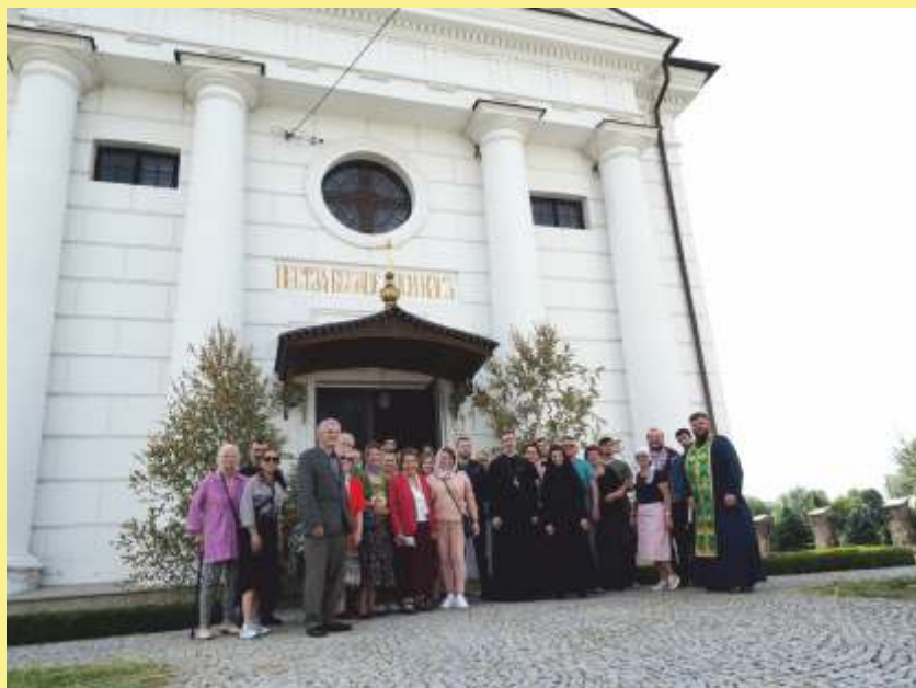
Przy cerkwi św. Jana Teologa w Terespolu.