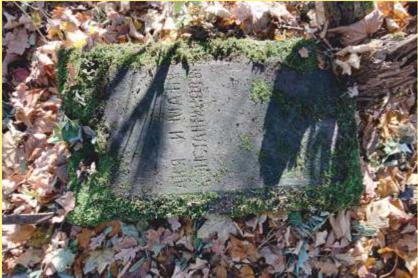
Napisy na zabytkowych nagrobkach.