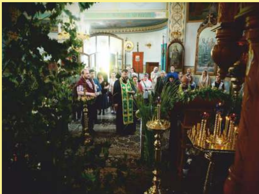
Modlitwa przed cudowną Ikoną Matki Bożej „Szybko Spełniającej Prośby”.