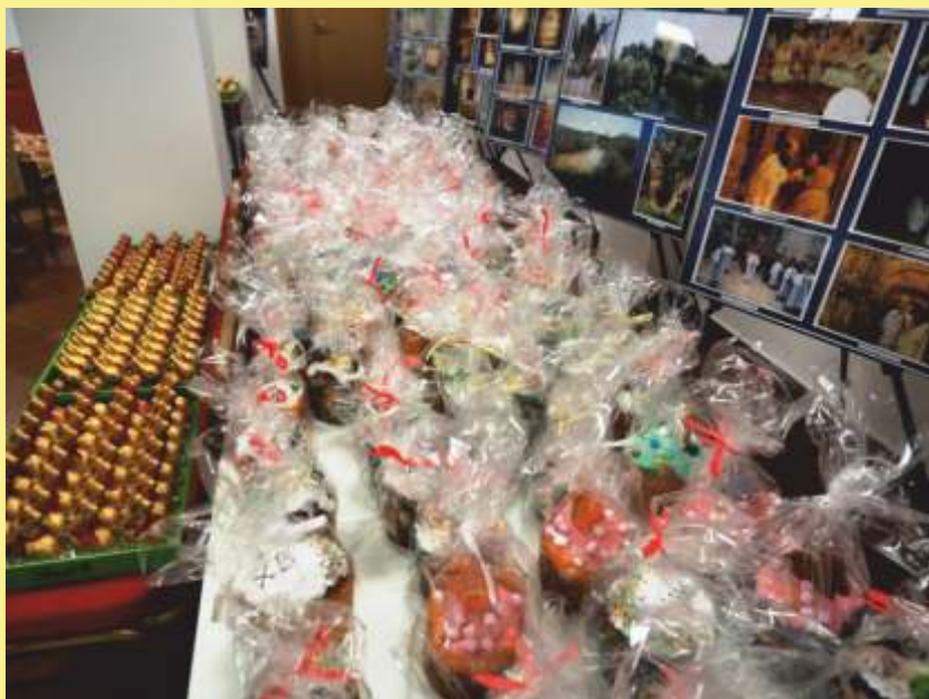
Przygotowanie paczek świątecznych oraz modlitewników z psalterzami.