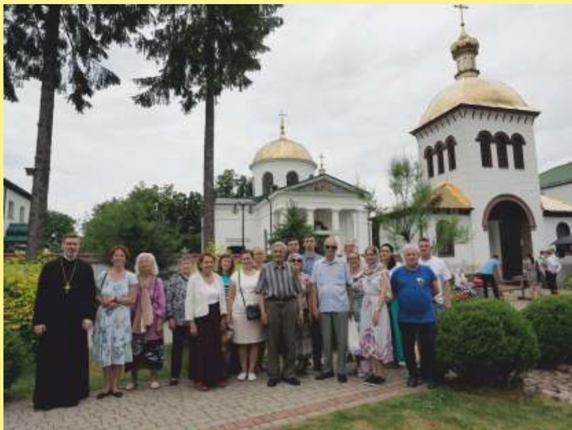
Odwiedziny w monasterach w Jabłecznej i Kostomłotach.